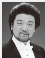
フィガロ 青戸 知