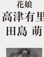
花娘 高津有里 田島 萌